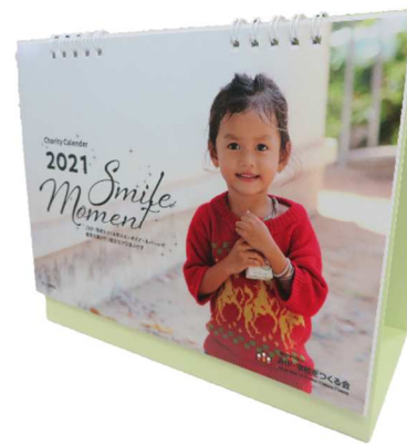
卓上型カレンダー斜め（表）