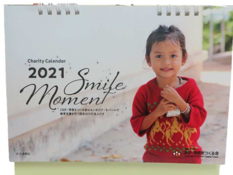
卓上型カレンダー正面（表）