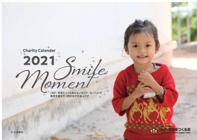
壁掛け型カレンダー（表）